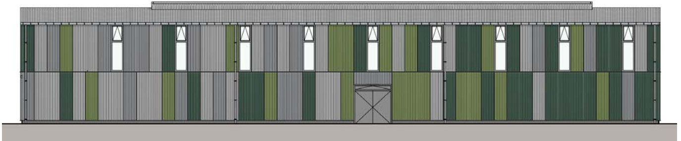
Nord-Fassade der Trainingshalle.

Masstab 1:100, einem detaillierten Baubeschrieb und einem plausibilisierten Kostenvoranschlag \pm 10\% in Zusammenarbeit mit diversen regionalen Unternehmern für den Neubau einer provisorischen Trainingshalle mit zusätzlichen Optionen (Garderobe und öffentliche WC-Anlage) erarbeitet.